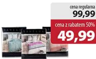
Pościel kpl 160 cm x 200 cm