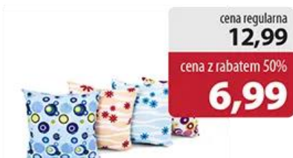
Poduszka Jasiek 40 cm x 40 cm