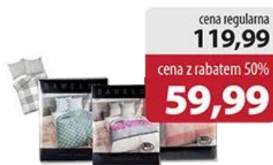
Pościel kpl 220 cm x 200 cm