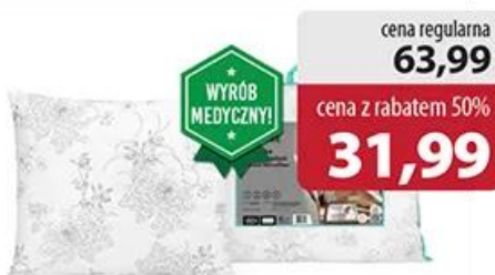
Poduszka Blumenslyst 50 cm x 60 cm