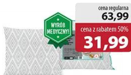
Poduszka Diamonds 50 cm x 60 cm