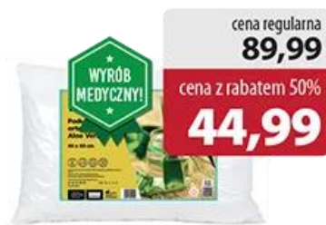
Poduszka Ortopedyczna Aloe Vera